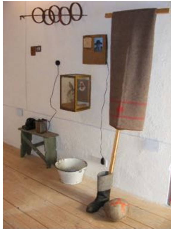
© M. Kröner 2013 „Beuys Nachlass aus der Sammlung Jägers“

Kunstkooperation ist ein wesentliches Element, deswegen leitet er auch mit seiner Partnerin die kleinste Galerie Pankows und ist als Kunstlehrer Überzeugungstäter.